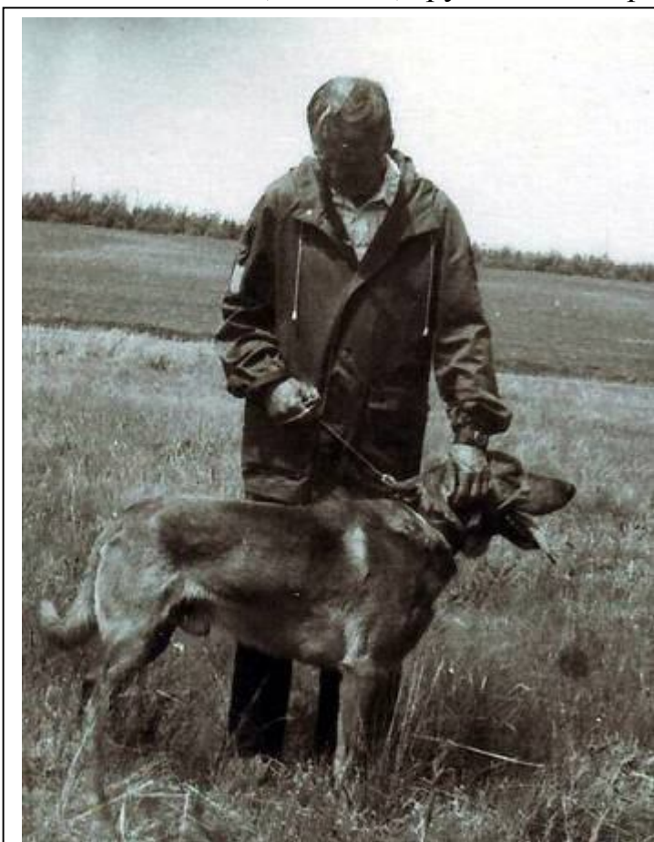
Громило ох.св. 1975рг

Мой «Громило»II-ох.св. 1975/рг имел рост 64-65 см, породную голову, мощное сложение, костист, грудь имел широкую и глубокую, ниже локотков,